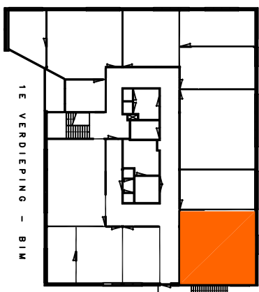
Gebouw (betreffende ruimte gearceerd)