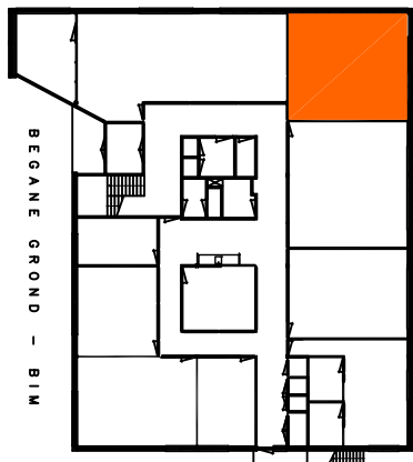
Gebouw (betreffende ruimte gearceerd)